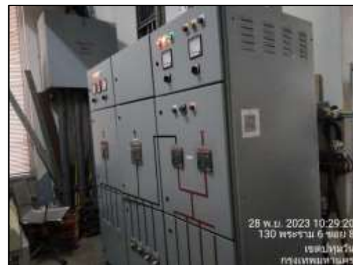
รูปที่ 1-6 เครื่องกำเนิดไฟฟ้า