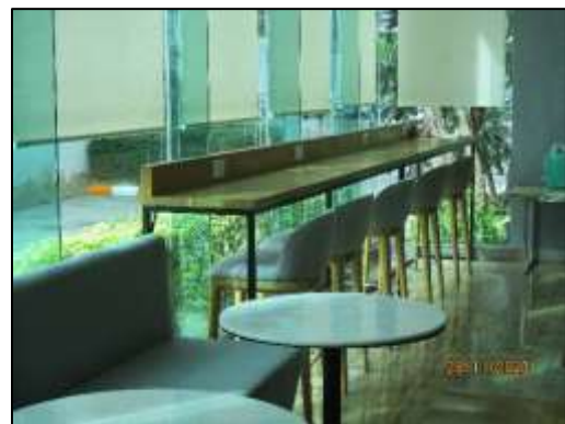
รูปที่ 1-11 (ต่อ) พื้นที่สีเขียว และพื้นที่นันทนาการของโครงการ