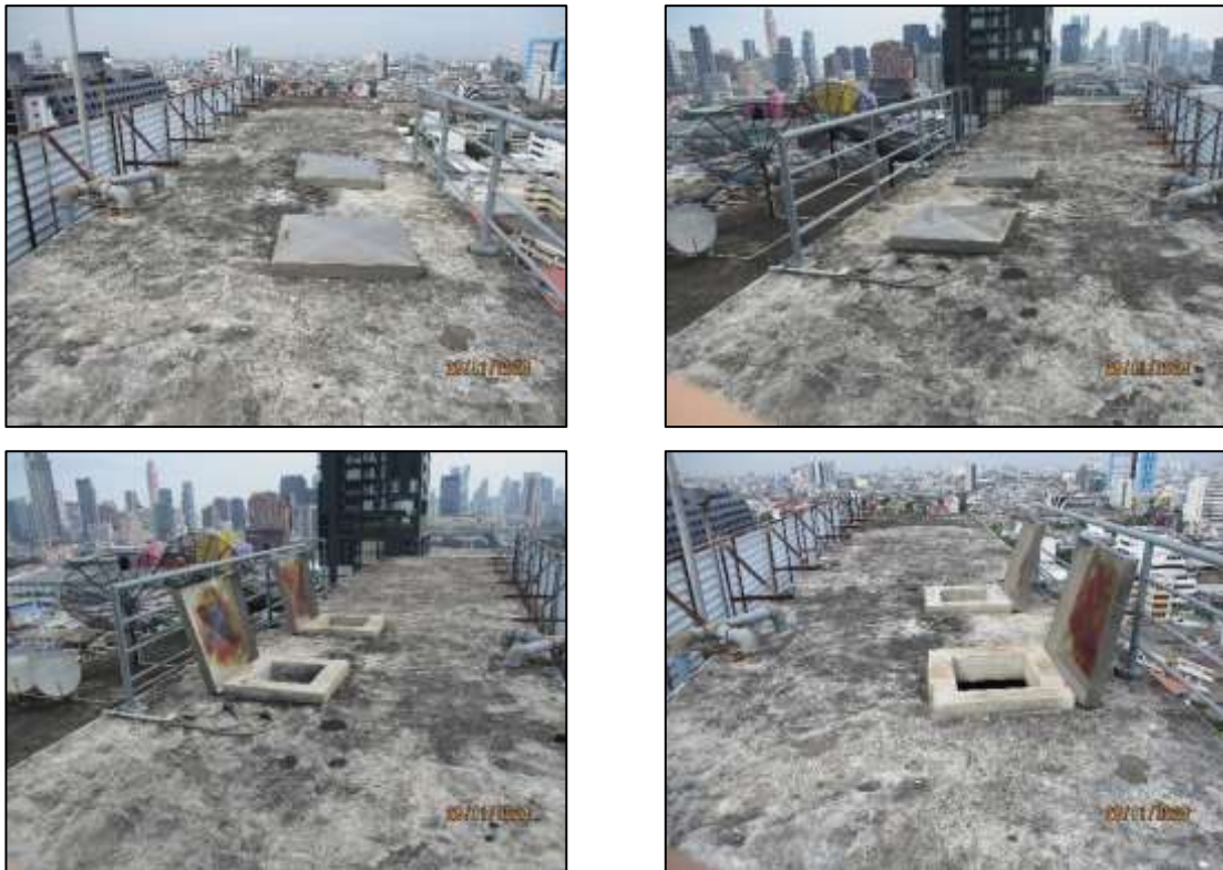
รูปที่ 1-3 ถังสำรองน้ำภายในโครงการ

1) แหล่งน้ำใช้ น้ำใช้สำหรับโครงการในช่วงเปิดดำเนินการแหล่งน้ำใช้ที่จ่ายให้แก่โครงการ คือ น้ำประปาจากการประปานครหลวง โดยโครงการตั้งอยู่ในพื้นที่ให้บริการน้ำประปาของการประปานครหลวง สาขาแมนศรี ซึ่งความต้องการใช้น้ำทั้งหมดของโครงการในช่วงเปิดดำเนินการ การประปานครหลวง สาขาแมนศรี จะสามารถจ่ายน้ำให้แก่โครงการได้อย่างเพียงพอ ซึ่งโครงการมีการกักเก็บน้ำสำรองไว้ที่ถังเก็บน้ำชั้นดาดฟ้า ดังแสดงในรูปที่ 1-3