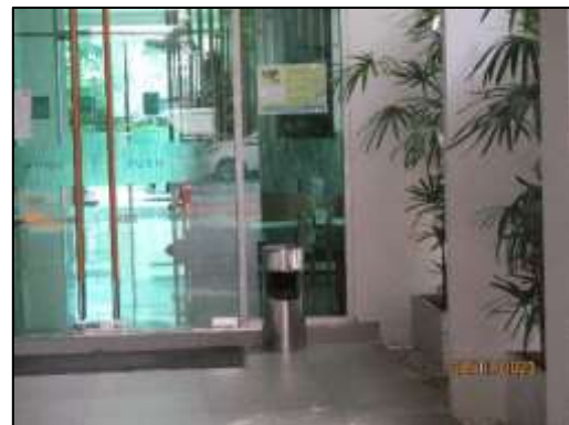
รูปที่ 1-8 ถึงขยะประจำโครงการ