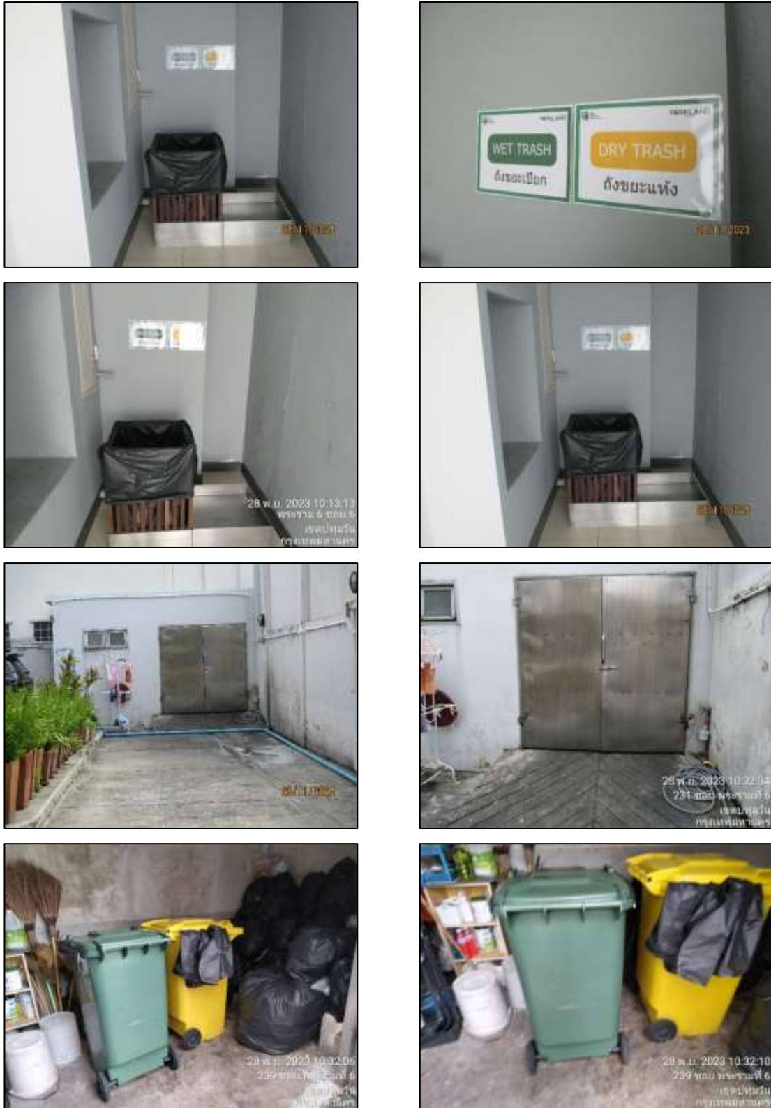
รูปที่ 1-9 ห้องพักขยะของโครงการ