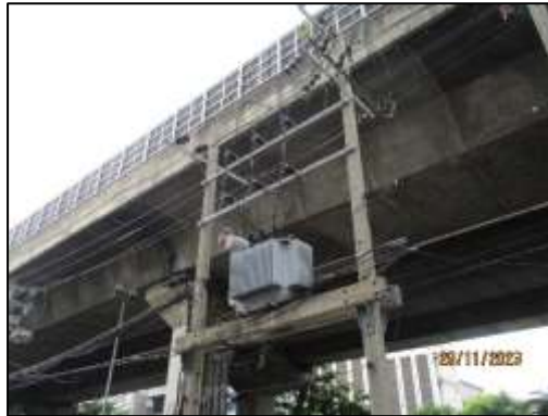
รูปที่ 1-5 หม้อแปลงไฟฟ้า

1) ระบบไฟฟ้าทั่วไป โครงการใช้ไฟฟ้าจากการไฟฟ้านครหลวง ซึ่งอยู่ในพื้นที่การให้บริการของการไฟฟ้านครหลวง เขตคลองเตย โดยได้รับการจ่ายไฟฟ้าผ่านด้านหน้าโครงการและเชื่อมเข้ากับหม้อแปลงไฟฟ้าของอาคาร ดังแสดงในรูปที่ 1-5