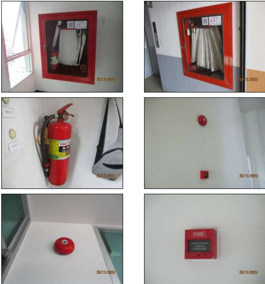
รูปที่ 1-10 ระบบป้องกัน และระงับอัคคีภัย

โครงการได้จัดให้มีการติดตั้งระบบป้องกันอัคคีภัย ตามตามที่ระบุไว้ในรายละเอียดโครงการให้เป็นไปตามกฎกระทรวงฉบับที่ 33 (2535), 39 (2537), 47 (2540), 50 (2540) และ 55 (2543) และข้อบัญญัติกรุงเทพมหานคร เรื่อง ความคุ้มครองอาคาร พ.ศ. 2544 ดังแสดงในรูปที่ 1-10