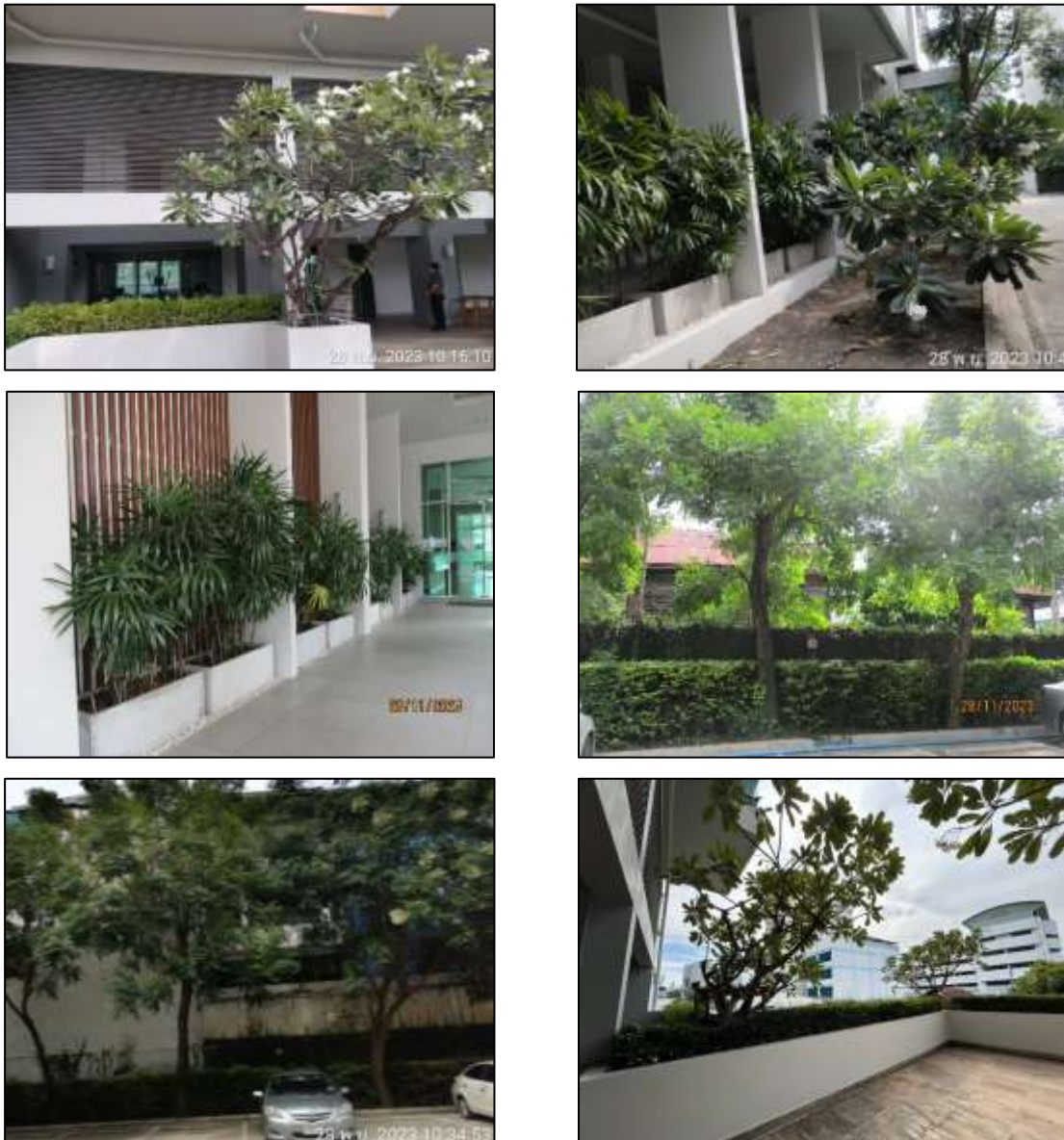
รูปที่ 1-11 พื้นที่สีเขียว และพื้นที่นันทนาการของโครงการ

พื้นที่สีเขียวและพื้นที่สำหรับพักผ่อนนันทนาการของโครงการ เป็นพื้นที่ส่วนกลาง ที่ผู้พักอาศัยสามารถเข้าไปใช้ประโยชน์ในการพักผ่อน ผ่อนคลาย ออกกำลังกาย บริเวณสวนหย่อม และต้นไม้บริเวณรอบๆ โครงการได้ ดังแสดงในรูปที่ 1-11