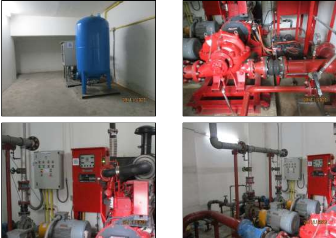
รูปที่ 1-4 ระบบจ่ายน้ำของโครงการ

2) ระบบจ่ายน้ำโครงการได้ติดตั้งระบบปั้มน้ำ 2 ระบบ คือ ระบบจ่ายน้ำใช้ทั่วไป โดยติดตั้งเครื่องสูบน้ำ เพื่อสูบน้ำจากถังสำรองน้ำของโครงการจ่ายไปยังส่วนต่างๆของอาคาร และระบบจ่ายน้ำดับเพลิง โดยติดตั้งเครื่องสูบน้ำดับเพลิง (Fire pump) จำนวน 1 ชุด ติดตั้งไว้บริเวณห้อง Fire pump เพื่อทำหน้าที่สูบน้ำจากถังเก็บน้ำดับเพลิงจ่ายไปยังหัวจ่ายน้ำดับเพลิง และระบบดับเพลิงของโครงการ ดังแสดงในรูปที่ 1-4