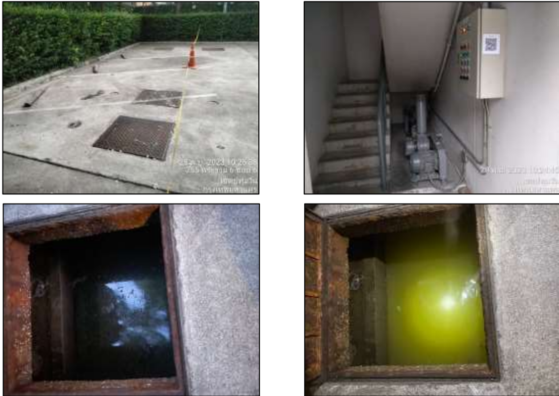
รูปที่ 1-7 ระบบบำบัดน้ำเสียของโครงการ

โครงการออกแบบให้มีระบบบำบัดน้ำเสียรวม จำนวน 1 ชุด รองรับน้ำเสียจากกิจกรรมต่างๆ ที่เกิดขึ้นจากโครงการ เข้าระบบบำบัดน้ำเสียรวมแบบ Fixed Film Aeration Process ก่อนระบายออกสู่ภายนอกโครงการ ดังแสดงในรูปที่ 1-7